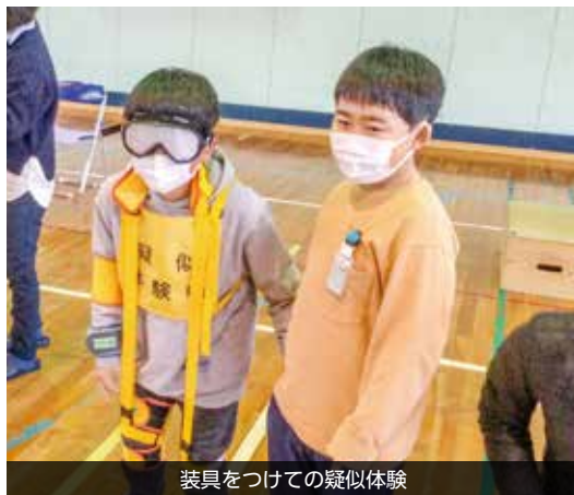
装具をつけての疑似体験