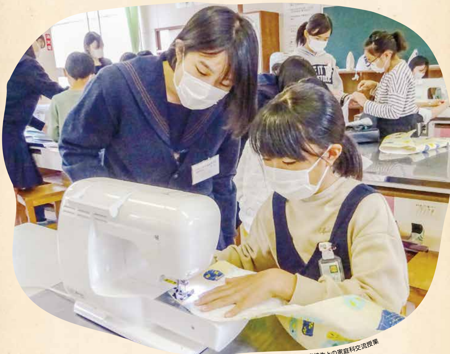
高校生との家庭科交流授業