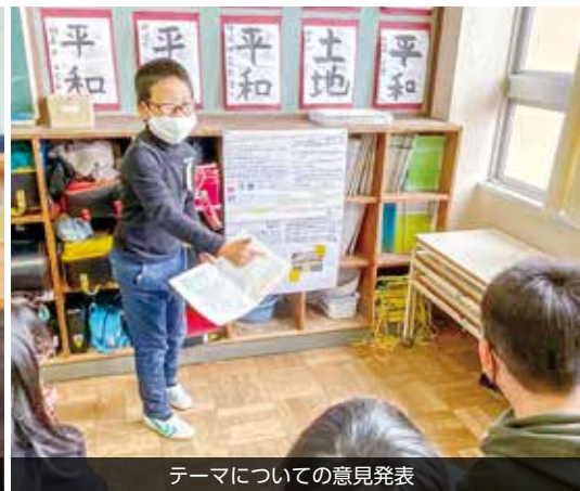
テーマについての意見発表

明道小学校では、4年生が総合的な学習の時間に、車いす体験と高齢者疑似体験を行いました。体験を通して、高齢者への理解を深めるとともに、高齢者をはじめ、みんなに温かいまちにしていくために、自分に何ができるかを考えました。子どもたちからは、「普段自分たちが当たり前に行っていることが高齢者にとっては難しいことだと分かった。」「介護する側の人も大変だところを見かけたら声をかけたい。」など、様々な意見が出てきました。そして、「相手を思いやり、みんなで支え合っていきたい。」という思いを強くしました。