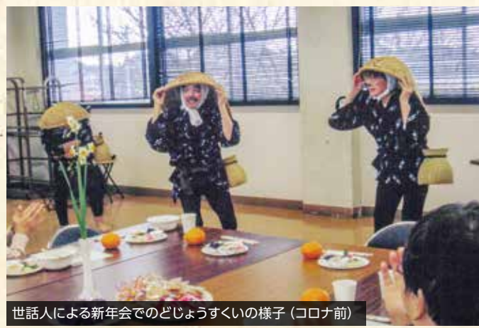
世話人による新年会でのどじょうすくいの様子 (コロナ前)