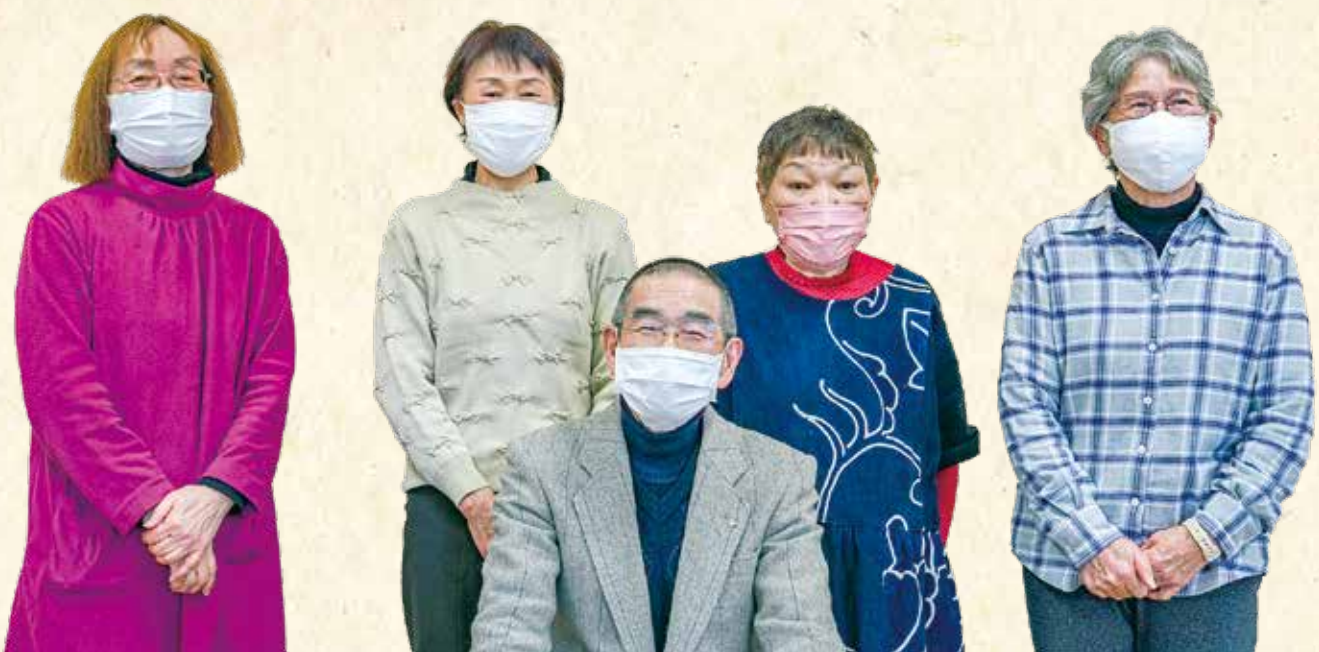
サロンを支える世話人の皆さん