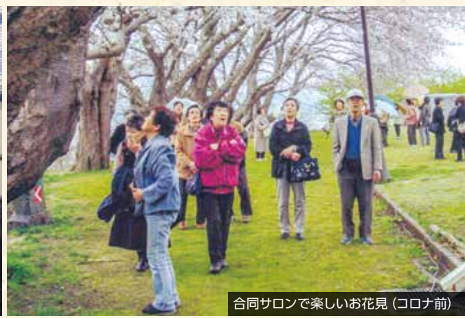
合同サロンで楽しいお花見 (コロナ前)