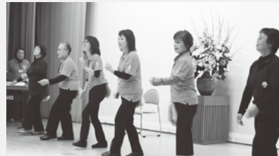
ザカリア手話サークル