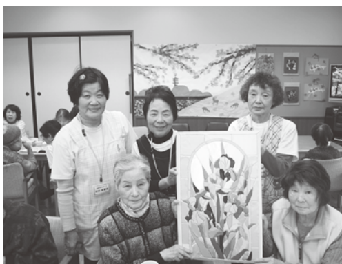
ボランティアさんとの共同作品