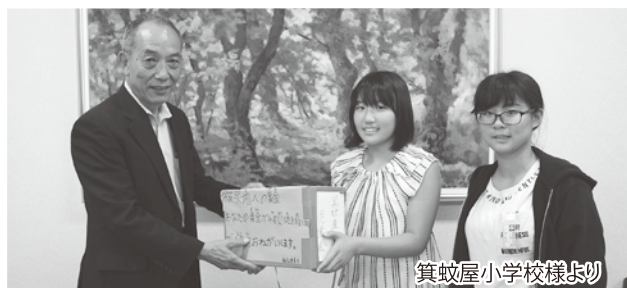
箕蚊屋小学校様より

平成三十年北海道胆振東部地震災害義援金 (湊山中学校)……………一〇、一九五円 平成三十年七月豪雨災害義援金 一五二、六六七円 (米子市老人クラブ連合会)……………三三六、六〇〇円 (箕蚊屋小学校)……………八、一六七円 (ボランティア協議会)……………七、九〇〇円