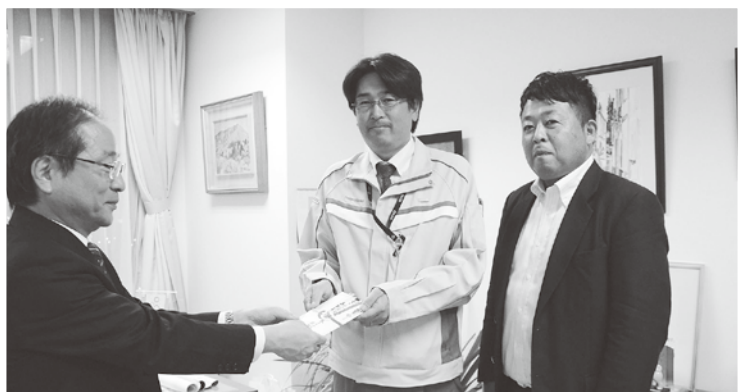
米子ケヤキ通り振興会様より

11月7日に「米子ケヤキ通り振興会」様より「第八回米子ケヤキ通りチャリティゴルフコンペ募金」として141,089円のご寄付をいただきました。ご寄付は交通遺児の福祉の向上を図るために交通遺児激励金として活用させていただきます。