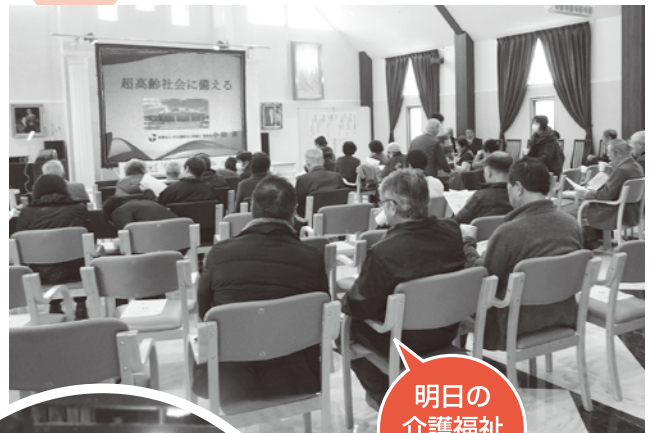
明日の介護福祉勉強会

地区社協会長が企画・立案した「明日の介護・福祉勉強会」では、自治会や地元法人の協力も得て約50名が参加され、老後を皆で考える盛大な会となりました。