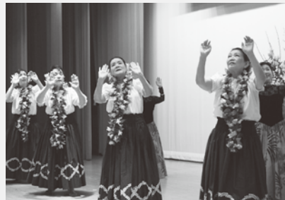
ボランティアクラブ カレント