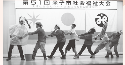
職員有志による演劇