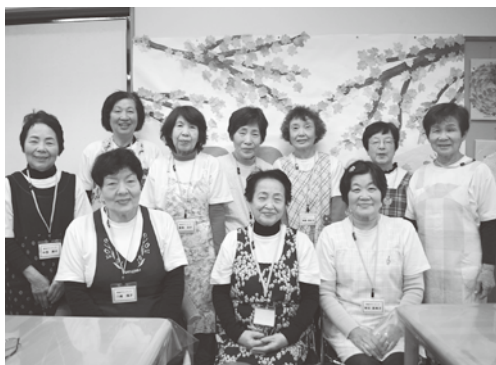
啓成よつ葉の会の皆さん