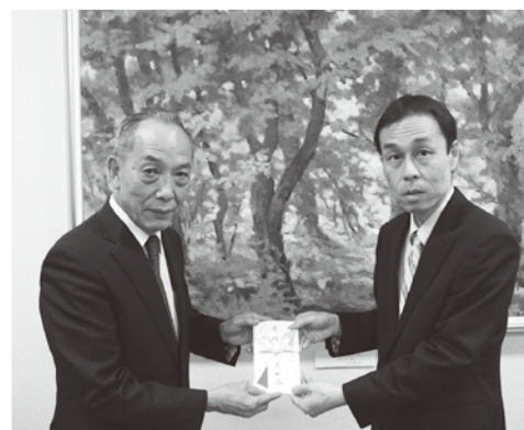
真如苑米子支部様より

11月7日に「米子ケヤキ通り振興会」様より「第八回米子ケヤキ通りチャリティゴルフコンペ募金」として141,089円のご寄付をいただきました。ご寄付は交通遺児の福祉の向上を図るために交通遺児激励金として活用させていただきます。