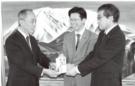
米子紅白対抗歌合戦 実行委員会様より

恒例の「社会福祉チャリティー」第三十八回米子市民余芸大会は昨年十二月十六日に米子コンベンションセンターで開催されました。各職場や団体、知名人などがバラエティーに富んだ芸を披露され観客の皆さんに楽しんでいただきました。 なお、山陰中央新報社様から収益金の一、二五八、五一七円は米子市を通じ本会にご寄付いただきました。この収益は、社会福祉事業の充実発展および福祉団体等への活動費に役立たせていただきます。