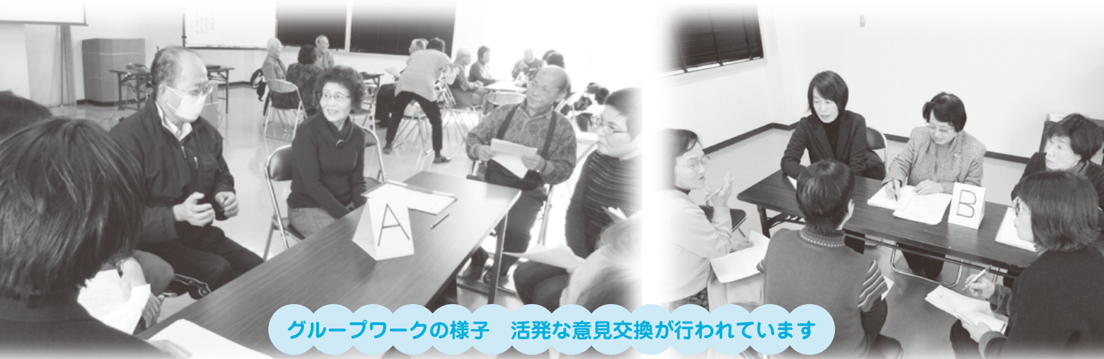
グループワークの様子 活発な意見交換が行われています