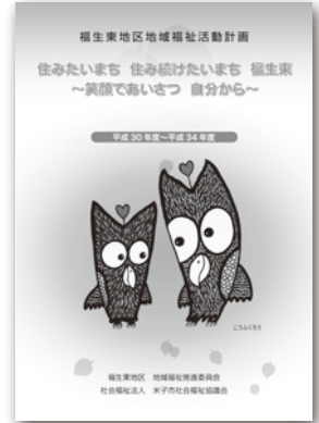
【表紙イラスト】玉井詞(たまいつかさ)氏