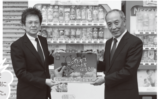
ご協力ありがとうございました。