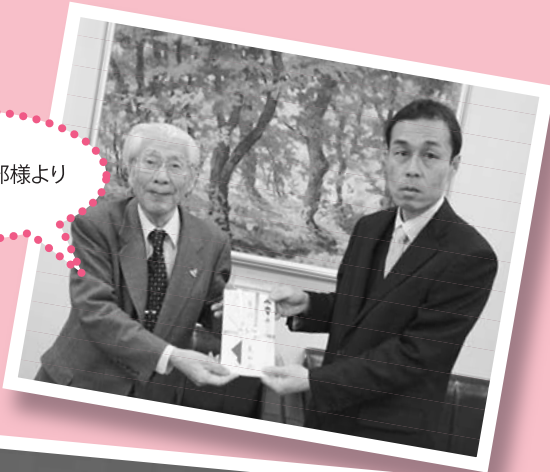
真如苑米子支部様より

十二月十五日に「全日本自動車産業労働組合総連合会」様より車いす対応の車両一台をご寄贈いただきました。いただいた車両はデイサービスでの送迎に活用させていただきます。