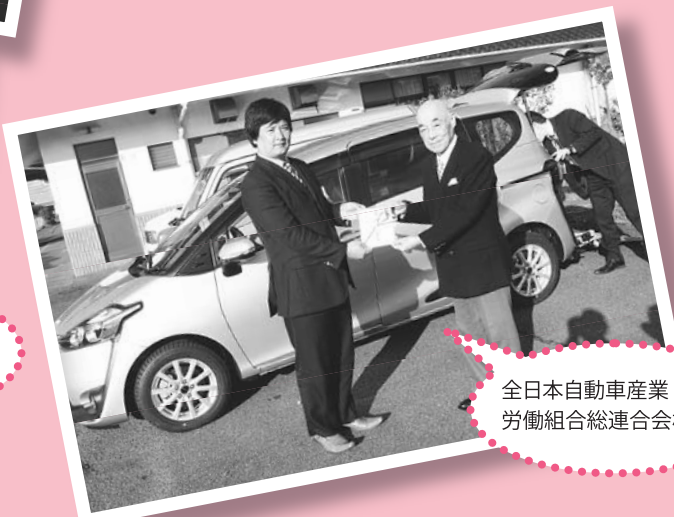
全日本自動車産業 労働組合総連合会様より