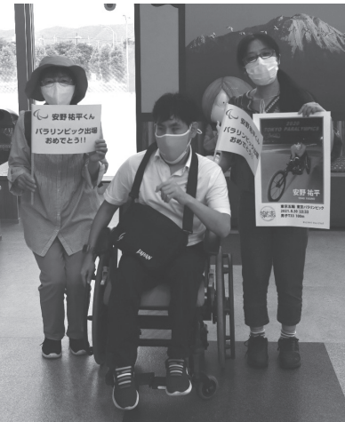
出発前、空港でお見送りをしました。