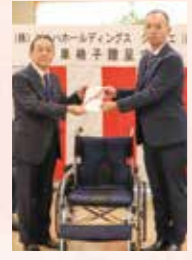
11月15日付け 日本海新聞

ありがとうございました。 11月15日に「米子ケヤキ通り振興会」様より「米子ケヤキ通り親睦チャリティゴルフコンペ」チャリティ募金として110,105円のご寄付をいただきました。 ご寄付は交通遺児福祉の向上を図るために交通遺児奨励金として活用させていただきます。 車いすを寄贈いただきました 11月29日に県立福祉人材センターで「株ッルハホールディングス」と「クラシエ株」様より自走式車椅子1台を寄贈頂きました。 車椅子の無料貸出に活用させていただきます。