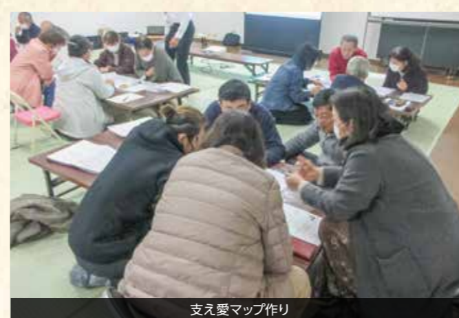
支え愛マップ作り