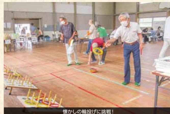
懐かしの輪投げに挑戦!

参加を目標としています。皆さまに一緒に喜んで頂けるようスタッフ一同誠心誠意尽くしたいと考えております。 地域社会福祉部のサポート役として地域社会福祉部があります。役割の中で特に防災活動に関するサポートは重要です。「支え愛マップ」づくりの推進と指導は積極的に進めており、実際のこの地図を片手に訓練を行うと、自分の役割が明確化されているので動き易いことに気づきます。このマップは「あなたの命を守るマップ」と言えます。写真は清水ヶ丘自治会でのマップ作成の様子です。このほか、救急医療情報キット（安心キット）を全家庭に配布し、救急隊員が駆け付けた時に必要な情報がすぐわかるようにしています。【今回は大高地区を紹介します】