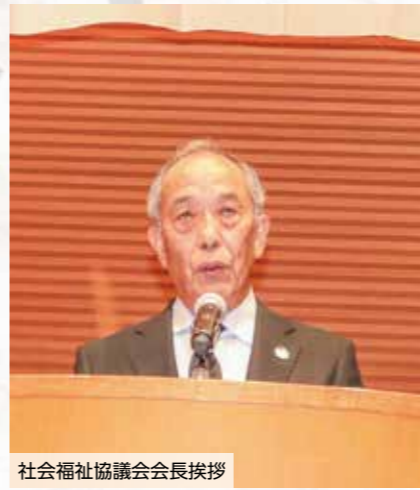
社会福祉協議会会長挨拶