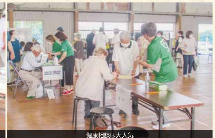
健康相談は大人気