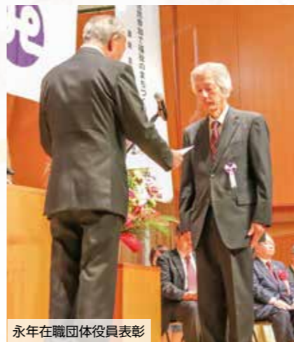
永年在職団体役員表彰

11月2日に米子コンベンションセンター小ホールで、「第53回米子市社会福祉大会」を米子市との共催により開催いたしました。