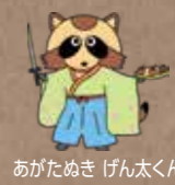
あがためき げん太くん