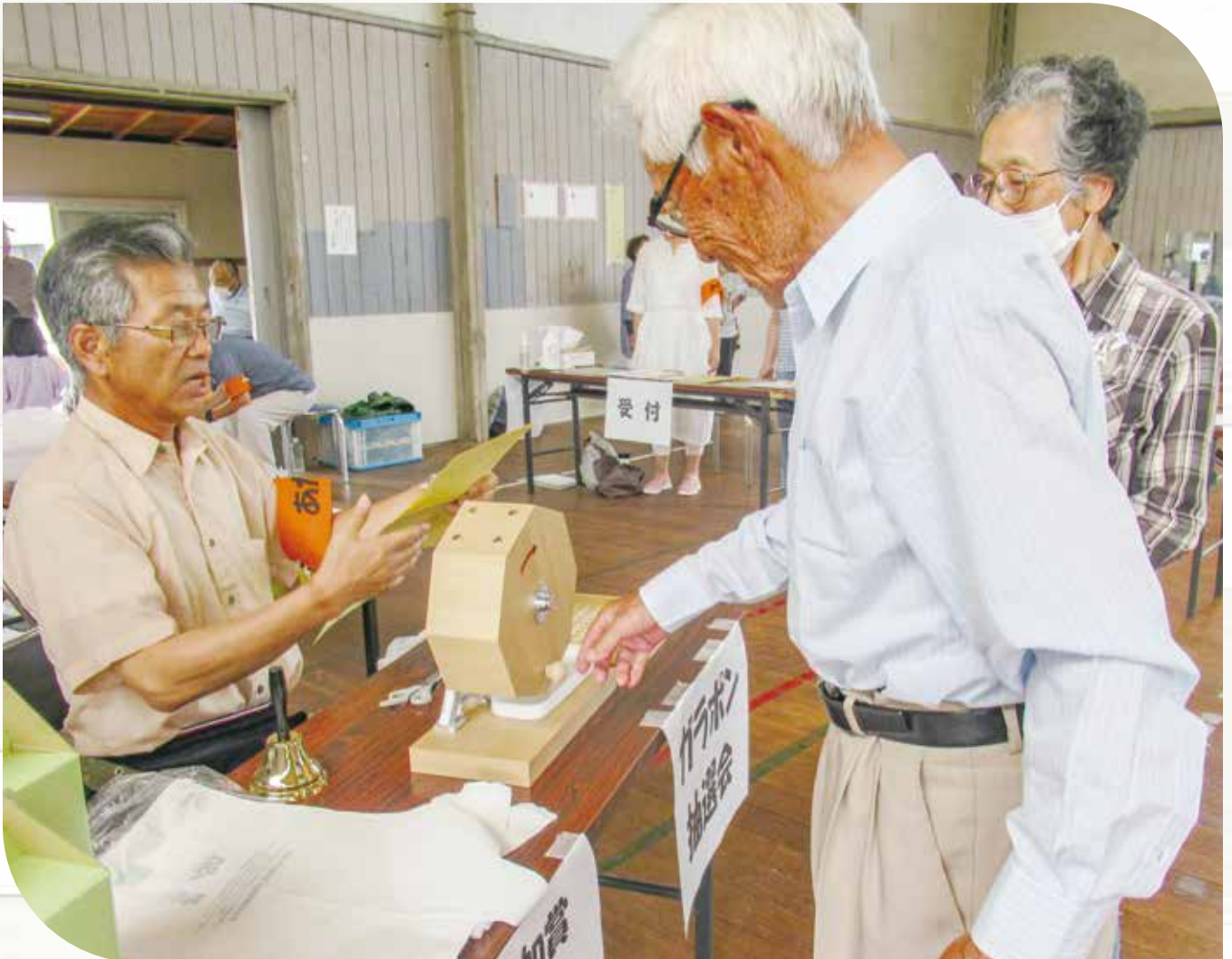
県地区 健康まつり (お楽しみのガラポン抽選会)