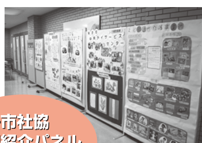
米子市社協 各課紹介パネル コーナー展示