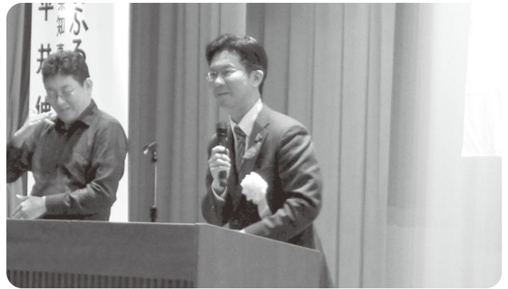
伊木市長の講演と手話通訳