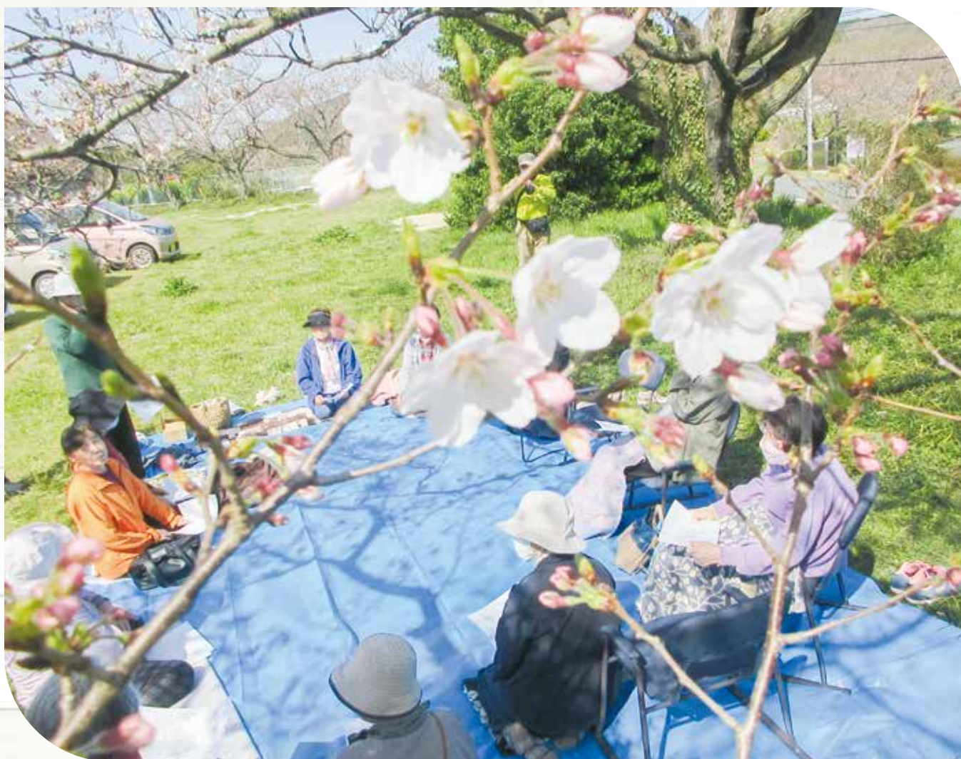
宇田川いきいきサロンの「花見の会」